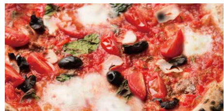
ロマーナ 1400 Romana トマトソース、フレッシュトマト、アンチョビ、ニンニク、 オリーブ、バジル、モッツァレラ tomato sauce, fresh tomato, anchovy, garlic, olive, basil, mozzarella cheese