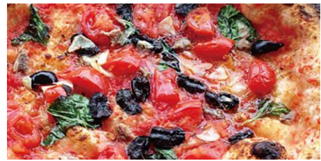
ナポレターナ 1290 Napoletana トマトソース、フレッシュトマト、アンチョビ、 バジル、ニンニク、オリーブ tomato sauce, fresh tomato, anchovy, garlic, olive