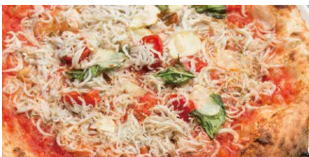
チチニエッリ 1290 Cicinielli シラス、オレガノ、トマトソース、七味とうがらし、 バジル、ニンニク whitebait, oregano, tomato sauce, basil, shichimi spice mix, garlic