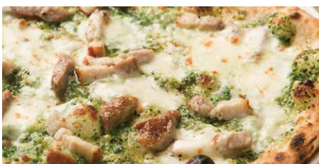
ブラッチョディフェッロ 1510 Braccio di Ferro ほうれん草、リコッタチーズ、自家製ベーコン、 モッツァレラ spinach, ricotta cheese, homemade bacon, mozzarella cheese