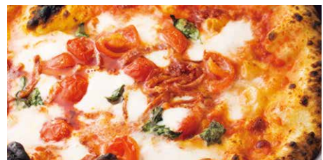
カラブレーゼ 1780 Calabrese モッツァレラ、燻製水牛モッツァレラ、ピカンテサラミ、 トマトソース、バジル、ンドゥイヤ、グラナパダーノ mozzarella, smoked buffalo mozzarella, 'nduja, spicy salami, tomato sauce, basil, Grana Padano cheese