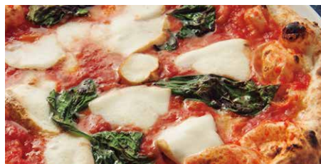
燻製モッツァレラのマルゲリータ 1780 Margherita w/ Smoked Mozzarella Cheese 燻製水牛モッツァレラ、トマトソース、バジル、 グラナパダーノ smoked mozzarella cheese, tomato sauce, basil, Grana Padano cheese