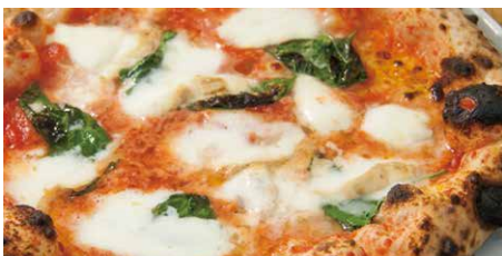
水牛モッツァレラチーズのマルゲリータ 1720 Margherita w/ Buffalo Mozzarella Cheese 水牛モッツァレラ、トマトソース、バジル、 グラナパダーノ buffalo mozzarella cheese, tomato sauce, basil, Grana Padano cheese