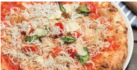
チチニエリ 1290 Cicinielli シラス、オレガノ、トマトソース、七味とうがらし、バジル、ニンニク whitebait, oregano, tomato sauce, basil, shichimi spice mix, garlic