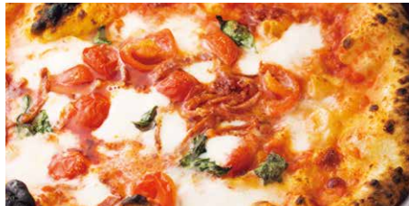
カラブレーゼ 1780 Calabrese モッツァレラ、燻製水牛モッツァレラ、ピカンテサラミ、トマトソース、バジル、ンドゥイヤ、グラナパダーノ mozzarella, smoked buffalo mozzarella, 'nduja, spicy salami, tomato sauce, basil, Grana Padano cheese