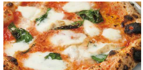
水牛モッツァレラチーズのマルゲリータ 1720 Margherita w/ Buffalo Mozzarella Cheese 水牛モッツァレラ、トマトソース、バジル、グラナパダーノ buffalo mozzarella cheese, tomato sauce, basil, Grana Padano cheese