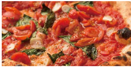
マリナーラ 910 Marinara トマトソース、バジル、ニンニク、オレガノ tomato sauce, basil, garlic, oregano