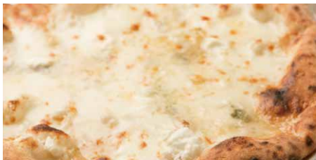
クワトロフォルマッジ 1720 Quattro Formaggi モッツァレラ、ゴルゴンゾーラ、タレグジョ、リコッタ、グラナパダーノ mozzarella cheese, gorgonzola cheese, taleggio cheese, ricotta cheese, Grana Padano cheese