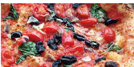
ナポレターナ 1290 Napoletana トマトソース、フレッシュトマト、アンチョビ、ニンニク、オリーブ tomato sauce, fresh tomato, anchovy, garlic, olive