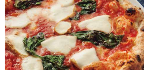
燻製モッツァレラのマルゲリータ 1780 Margherita w/ Smoked Mozzarella Cheese 燻製水牛モッツァレラ、トマトソース、バジル、グラナパダーノ smoked mozzarella cheese, tomato sauce, basil, Grana Padano cheese