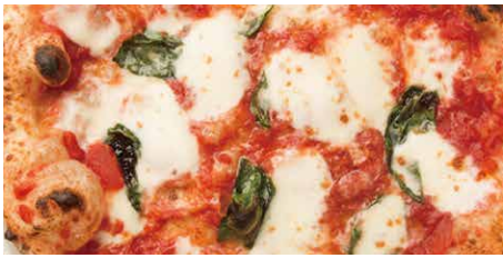
マルゲリータ 1290 Margherita トマトソース、バジル、モッツァレラ、グラナパダーノ tomato sauce, basil, mozzarella cheese, Grana Padano cheese