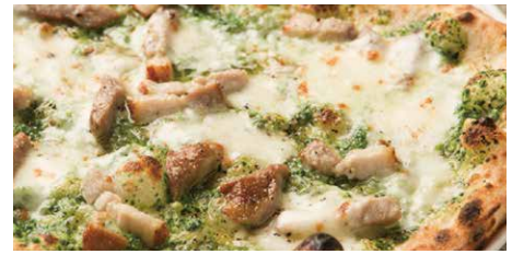
ブラッチョディフェットロ 1510 Braccio di Ferro ほうれん草、リコッタチーズ、自家製ベーコン、モッツァレラ spinach, ricotta cheese, homemade bacon, mozzarella cheese