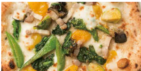
季節野菜のオルトナーラ 1510 Seasonal Vegetable Ortolana 季節野菜、自家製ベーコン、モッツァレラ、グラナパダーノ seasonal vegetables, homemade bacon, mozzarella cheese, Grana Padano cheese