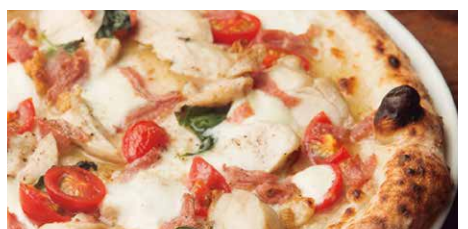
大和肉鶏のディアボラ 1620 Local Chicken Diavola 鶏肉、唐辛子、グラナパダーノ、オレガノ、ミニトマト、ナポリサラミ、モッツァレラ、バジル chicken, mozzarella cheese, oregano, basil, Napoli salami, Grana Padano cheese, cherry tomatoes, red pepper